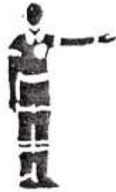
1. Начало периода