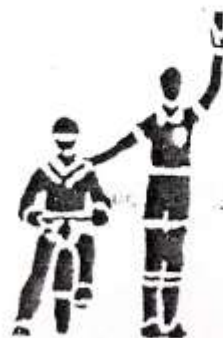
10. Удачение игрока