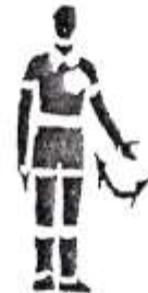
8. Продолжать игру.