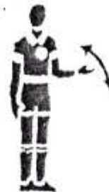
9. Пронос мяча.