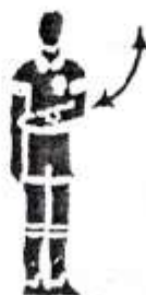
5. Игра рукой.